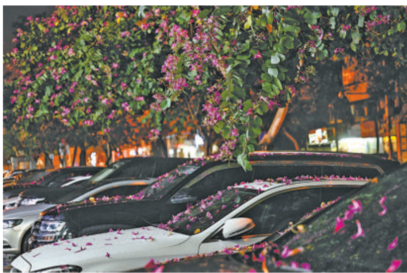
雨中落下的洋紫荆花给树下的车披上“花衣”。

本报讯(记者 朱道衡)昨日早晨,阵雨突袭鹭岛,不过很快停歇,午间日头露露面,气温随之略有回升。