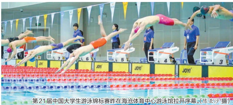
第21届中国大学生游泳锦标赛昨在海沧体育中心游泳馆拉开序幕。

本报讯(记者 林岑)昨日上午,第21届中国大学生游泳锦标赛,在海沧体育中心游泳馆拉开序幕,本届赛事将持续4天。