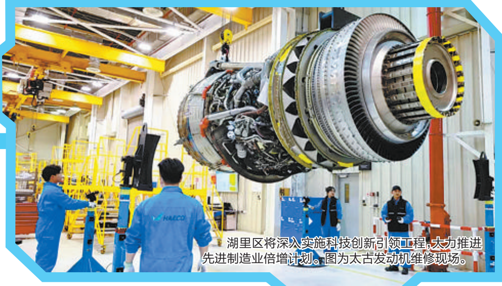
湖里区将深入实施科技创新引领工程,大力推进先进制造业倍增计划。图为太古发动机维修现场。