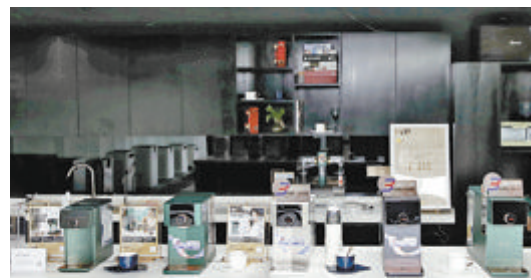
▲艾恩姆自主研发的产品。

IAM(艾恩姆集团有限公司)在热水机和空气净化器领域拥有较为领先的研究技术创新能力,公司已自主拥有8项发明专利、37项实用新型专利、32项外观设计专利;2019年,获评厦门市“高新技术企业”;2020年,获评国家级“高新技术企业”及厦门市科技“小巨人”领军企业。去年“双11”,IAM空气净化器在空净市场的份额行业排名第二。