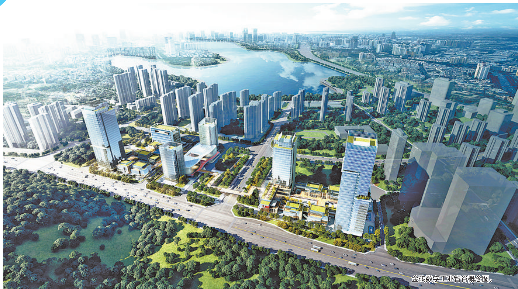
金砖数字工业智谷概念图。