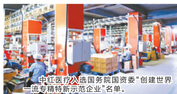
中红医疗入选国务院国资委“创建世界一流专精特新示范企业”名单。