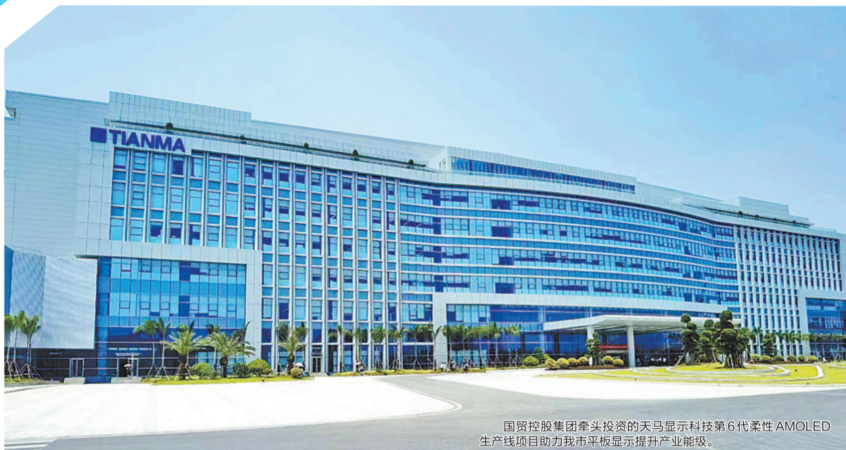
国贸控股集团牵头投资的天马显示科技第 6 代柔性 AMOLED 生产线项目助力我市平板显示提升产业能级。

随着天马项目的落地见效，一批产业链上下游配套企业在厦集聚、抱团发展，为厦门平板显示产业强链补链链提供有力支撑，显著提升了厦门在全球显示领域的区域中心地位。 前瞻谋划，持续培育新动能。国贸控股集团旗下海翼集团成立厦门国贸新能源科技有限公司。今年 3 月初，国贸新能源首个清洁能源项目——厦门信达信息产业园光伏项目正式启动，项目建成后，预计首年发电量约 84 万度，每年可节约标准煤约 95 吨，降低二氧化碳排放约 700 吨，降低二氧化硫排放约 1.65 吨。对节能减排的贡献，相当于植树造林 700 亩。 按计划，国贸新能源将以拓展优质光伏等业务为切入点，布局氢能、风电、储能等新业务，构建海翼集团新能源产业生态，致力于成为区域性新能源综合服务与系统解决方案提供商。