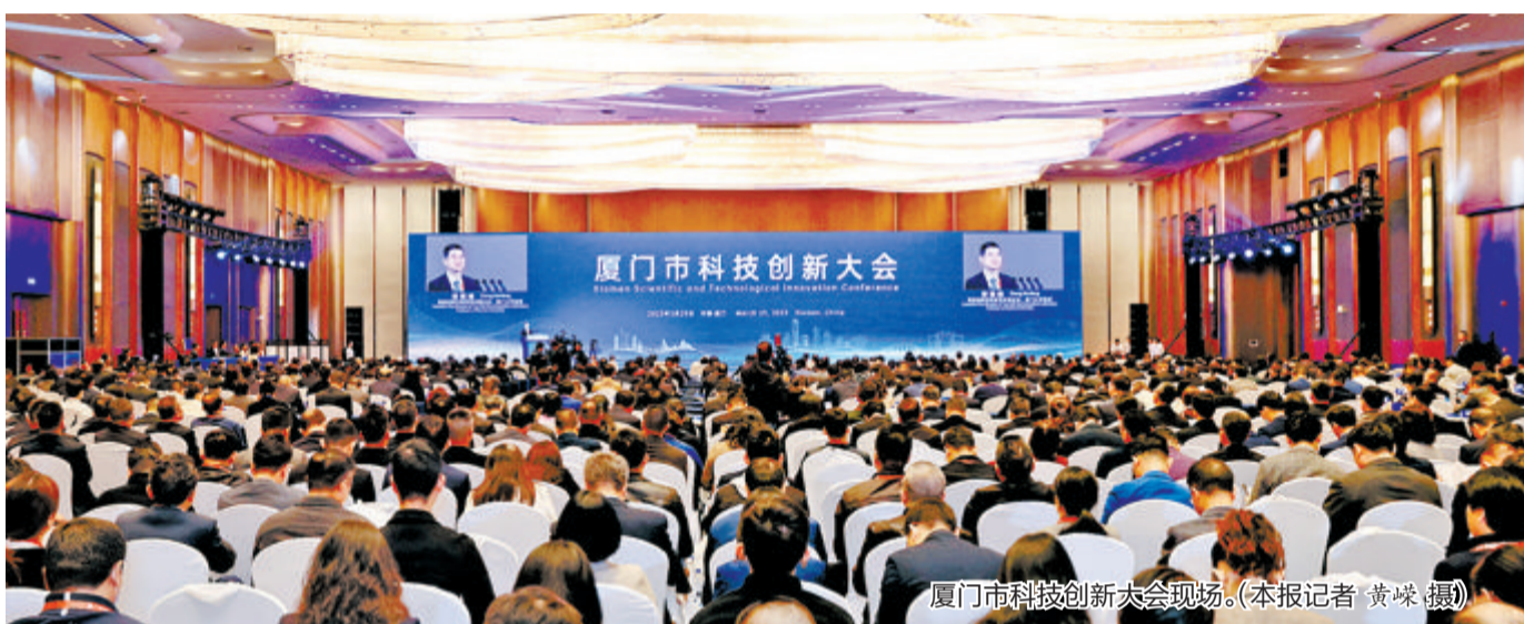
厦门市科技创新大会现场。

窦贤康对厦门市科技创新大会的召开表示祝贺。他说，科技自立自强是全面建设社会主义现代化国家的必然要求。以习近平同志为核心的党中央高度重视科技创新工作，党的二十大对加快实施创新驱动发展战略作出全面部署。新一轮科技革命和产业变革正在蓄势待发的关键时期，既为我国建设科技强国提供了难得的历史机遇，也提出了新的课题和挑战。厦门坚持把创新作为引领发展的第一动力，秉持开放包容、合作共赢的理念，成功汇聚了一批高层次科技人才，打造了一批高水平创新平台，创新生态优越，创新活力充沛，创新氛围浓厚，科技创新不断取得新突破、新进展。当前，厦门市委市政府把科技自立自强作为推动高质量发展的战略支撑，对创新驱动发展作出一系列重大部署，展现了加快实施科技创新引领工程，发挥优势、赢得主动的信心决心。我们将按照中央部署，大力支持厦门瞄准国家