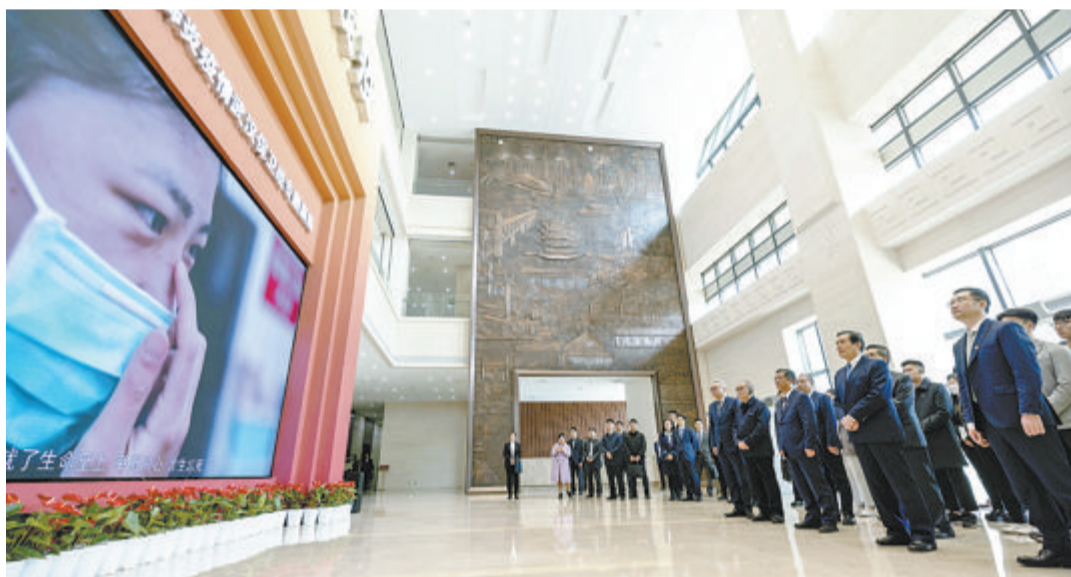
3月30日上午，马英九一行来到武汉市档案馆，参观《英雄战疫——抗击新冠肺炎疫情武汉保卫战专题展陈》。

马英九对习近平总书记的问候表示感谢。他表示，两岸同胞同属中华民族，应携手合作，在“九二共识”既有政治基础上，推动两岸关系和平发展，促进两岸永续和平与繁荣，提升两岸中国人福祉、共同振兴中华。