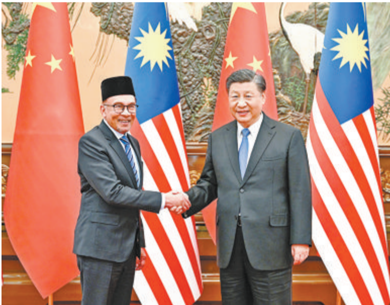
▲习近平会见马来西亚总理安瓦尔。