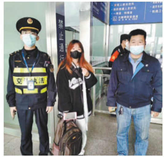
执法人员、爱心的哥(右)将背包交还给外籍乘客同伴。

本报讯(通讯员 饶靖东 记者 林钦圣)外籍人士背包遗落在出租车上,热心的哥主动折返寻找失主,与交通执法人员合力帮助送回。