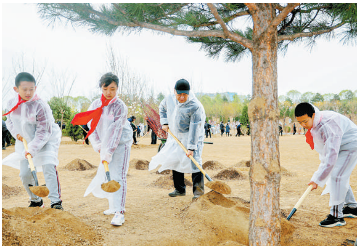
4月4日，党和国家领导人习近平、李强、赵乐际、王滄寧、蔡奇、丁薛祥、李希、韩正等冒雨来到北京市朝阳区东坝中心公园参加首都义务植树活动。这是习近平同大家一起植树。

习近平对大家说，我国人工造林规模世界第一，而且还在继续造林。地球绿化，改善全球气候变化，中国功不可没，中国人民功不可没。森林既是水库、钱库、粮库，也是碳库。植树造林是一件很有意义的事情，是一项功在当代、利在千秋的崇高事业，要一以贯之、持续做下去。