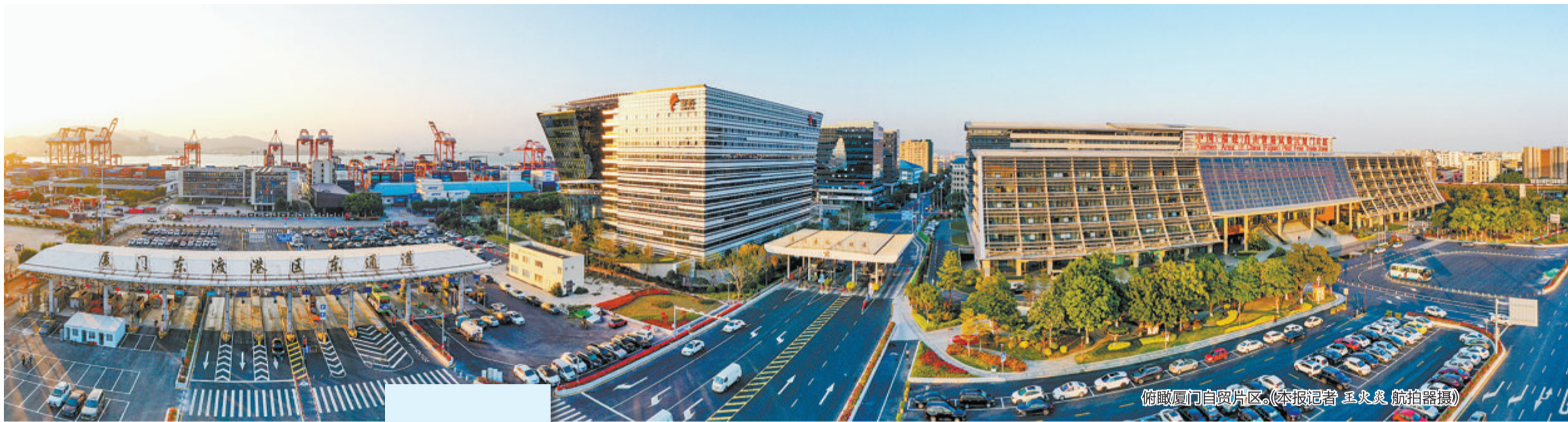
俯瞰厦门自贸片区。

本报记者 吴晓菁 通讯员 周莹 高安妮 曾滢滢 黄玉实 创新“链式通关”模式,为企业节约了大量调机费用、缩短调机时间;“融资”加“融物”,助力企业设备更新改造;推动发明专利权等无形资产融资租赁,有力推动了企业的技术研发进程;发挥综合保税区政策优势,完成首单带租约飞机资产包交易……一个个创新实践案例,是厦门自贸片区融资租赁产业发展的生动缩影。 作为全国重要的融资租赁产业集聚区,厦门自贸片区聚焦企业实际需求,持续通过制度、政策创新等手段,不仅为融资租赁企业顺利开展业务提供保障,增强企业获得感,同时也推动融资租赁产品服务优化,带动厦门自贸片区租赁业高质量发展。 截至2023年2月,在厦门自贸片区注册的融资租赁企业约400家,现有租赁资产总额超过1000亿元。其中,飞机租赁规模位居全国第四,二手飞机租赁居全国首位,集成电路租赁资产规模进入全国前三,航运租赁、影视设备租赁、绿色租赁等多元新业态发展态势好、潜力大。 今天,本报为您详解厦门自贸片区融资租赁产业的创新实践案例。