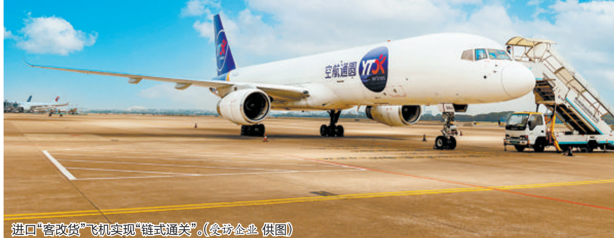
进口“客改货”飞机实现“链式通关”。(受访企业 供图)