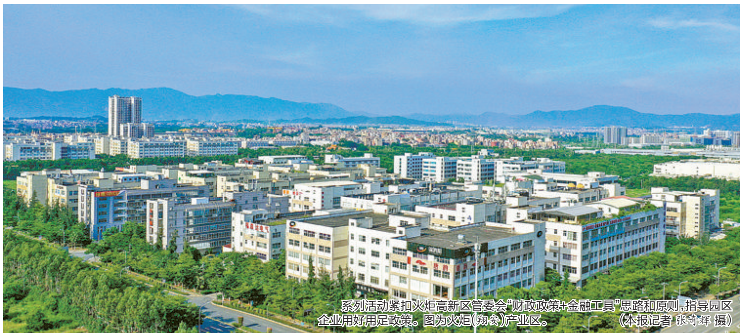
系列活动紧扣火炬高新区管委会“财政政策+金融工具”思路原则，指导园区企业用好政策。图为火炬(翔安)产业区。

本报记者 陈璐 林露虹 通讯员 甘伟革 金融活水赋能实体经济，助企纾困解难。4月11日，由厦门信息集团资本运营有限公司(以下简称“信息资本”)主办的产业扶持系列活动将在翔安悦华酒店拉开帷幕，首场活动聚焦“火炬厂易贷”，举办产品推进及政策宣讲会。