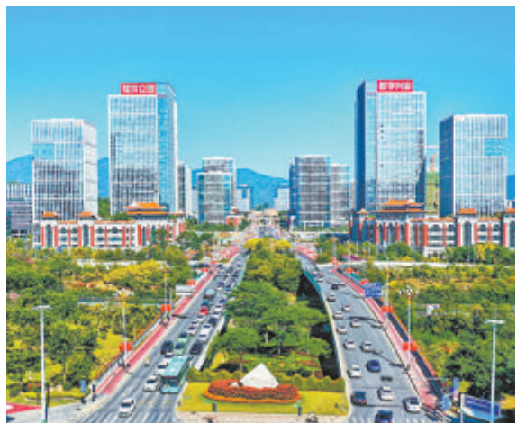
软件园金融服务中心推介会将带策进园区，赋能园区企业发展。图为软件园三期。(资料图)

此次系列活动紧扣火炬高新区管委会“财政政策+金融工具”思路原则，宣传和解读惠企金融政策，指导园区企业用好政策，满足企业发展资金需求，提高企业融资便利度，进一步增强企业获得感。