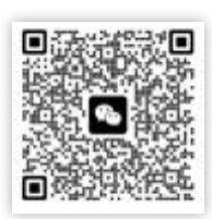
扫描二维码,加入申报辅导微信群。