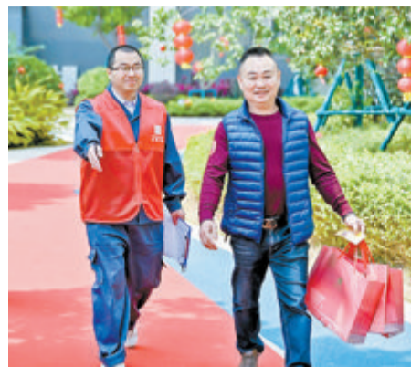
居民高兴地走进银霞花园安置房。

本报讯(文/图 记者 庄筱婧 通讯员 陈静阳)近日,银霞花园安置房启动返迁,居民们拿到了回家的“金钥匙”。