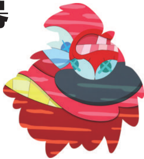
▲KAWS 卡布斯 TALK BACK 回嘴

在现当代艺术与潮流板块,保利厦门拍卖积极开拓国际视野,集结了多件当代艺术领域中极具热度和影响力的王牌力作。“亿元俱乐部”成员KAWS近年来拍场最大尺幅异形布面作品《回嘴》、“超扁平艺术教父”村上隆化身形象Mr.DOB主题作品《无题》、“中国新绘画”领军人物黄宇兴代表系列作品《生命的气泡》、“最具潜力的女性艺术家”塔尼亚·马尔莫列霍代表肖像作品《安全距离》、吴冠中1976年写生作品《树林》等,均为国内拍场罕见,透过精彩艺术飨宴,让全球藏家再度聚首鹭岛。