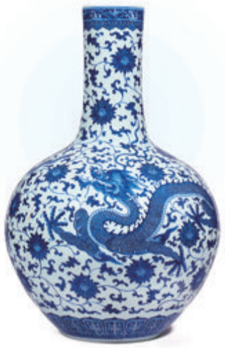
▲清乾隆青花穿莲龙纹大天球瓶

本报讯(记者 王飞颖 通讯员 郑飞白)保利厦门2023春拍将于下周启幕,选址厦门瑞颐大酒店,4月22日—24日预展,25日开拍。据保利厦门拍卖介绍,目前确定的拍品从瓷器玉器、文房及古董珍玩、佛教艺术、古典家具到中国书画、二十世纪及当代艺术再到贴近生活的潮玩、茗茶佳酿、珠宝首饰等,品类丰富。历经漫长冬季,本次春拍被各方寄予厚望。