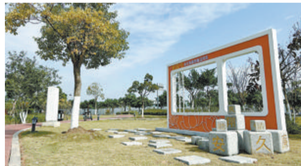
改造让公园既有颜值又有内涵。

本报讯(文/图 记者 邵凌丰 通讯员 袁一仁 洪小培)翔安街头两座口袋公园,刚刚完成了改造提升,最近已经全面投用——细心的居民发现,这两座公园在改造中都融入了“廉元素”。 下钟宅公园紧临地铁保障房。改造后,公园内随处可见清正廉洁语系和廉洁典故的造型,公园道路和景观分别以爱国桥、初心廊、百廉池、廉洁典故走廊等命名,将廉洁诗文、廉洁语系、廉洁故事等多种元素融入其中,使人文景观、自然景观和主题景观相得益彰。 位于汇景广场附近的街道公园,则以家家家风景观设计为主,打造了经典家风、红色家风、关爱小品等造型,充分将翔安家风好故事、好人物和传统家家家风文化元素融入公园的各个空间。 据了解,此次改造提升在翔安区纪委监委的指导下,由翔安区市政园林局绿化中心作为业单位,翔安区市政集团绿化工程有限公司进行代建。