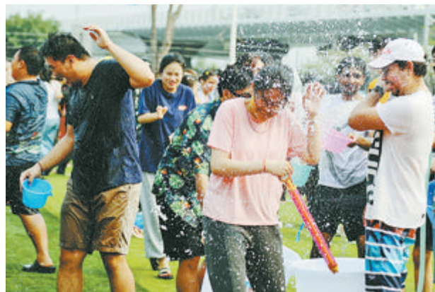
昨天下午,华大华文学院举办东南亚泼水节。

本报讯(文/图 记者 应洁)昨日下午,华侨大学华文学院2023年东南亚泼水节在龙舟池校区拉开帷幕,吸引400多名师生参与。各种肤色的留学生身着不同风格的服饰,在校园里奔走嬉戏,成为龙舟池畔一道充满异域风情的风景线。 开幕式在别具特色的泼水节游行仪式中拉开序幕,来自泰国、老挝、缅甸的留学生跳起精彩的传统舞蹈,引发在场师生的叫好和龙舟池畔游客的驻足。留学生们还向在场的嘉宾、老师们行“滴水礼”,表达感谢与祝福。随后,在欢乐喜庆的音乐中,肤色各异的留学生们拿着水瓢、水盆、水枪等工具奔向操场、相互泼水泼洒,表达欢度节日的喜悦和对彼此的美好祝福。 据介绍,华侨大学从20世纪80年代就开始举办泼水节活动,充分体现了华侨大学多元的校园文化。今年是疫情后首次重启这项活动。本周六、周日,华侨大学还将在厦门校区、泉州校区举办泼水节活动。