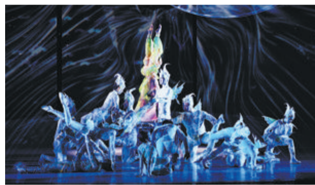
《化·蝶》在嘉庚剧院演出。

本报讯(记者 应洁 通讯员 应可欣)集杂技、舞蹈、戏剧等艺术形式于一体,用现代舞台技术重塑传统经典——4月13日、14日,广州市杂技艺术剧院带来的大型当代杂技舞剧《化·蝶》走进嘉庚剧院,连续两晚为鹭岛观众献上精彩表演。 《化·蝶》全剧以梁山伯和祝英台凄美浪漫的经典爱情故事为故事主线,结合庄周化蝶的哲学思想,多层次多角度讲述化蝶故事。 4月11日,《化·蝶》主创团队还走进集美中学,举办集美文艺讲堂137期“杂技舞剧《化·蝶》进校园分享会”,主创团队表示,希望通过这部作品带给年轻观众耳目一新的视觉享受,让更多人看到中国传统文化和杂技碰撞的火花。