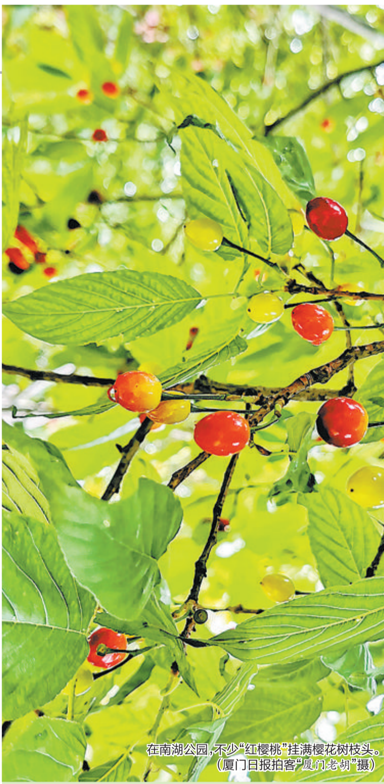
在南湖公园,不少“红樱桃”挂满樱花树枝头。

本报讯(记者 朱道衡)今天厦门进入汛期。每年的4月15日至10月31日,是我市汛期,其中7月至9月是主汛期。汛期到来意味着降雨将明显增多。气象部门预测,未来几天,我市多降水天气,气温前高后低,市民要注意防范,及时增减衣物。 昨天日头在岗,午间市气象台本站最高气温攀升到28.2℃,比前天高了3.1℃,全市有15个站点突破30℃大关,其中海沧区海翔大道甚至飙到了31.3℃,加之温暖潮湿的偏南风吹拂,市民普遍感觉偏热。 今天,冷暖气流交锋,我市会出现分散性的雷阵雨。需要提醒的是,由于风力微弱,空气潮湿,今天夜晨沿海地区会有雾气,大家驾车要注意安全。好在本次弱冷空气来去匆匆,影响短暂,明后天我市又将转为多云到晴天气为主。 气温方面,今起三天,我市城区最高气温维持在27℃至28℃,午间市民仍会感觉偏热。 然而,新一股冷空气已经在酝酿南下,预计后天抵厦。冷空气再次大打出手,下周二、周三,我市将出现一轮明显降水天气过程,并伴有雷雨大风、短时强降雨等对流天气,市民要提前做好防范措施。在冷空气和雨水双重打压下,气温下降,城区最高气温将回落至25℃。