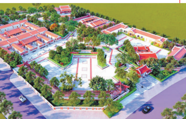
▼坂美民俗文化园即将开工建设(图效果图)。

据岛内大提升指挥部规建部负责人介绍，《岛内大提升项目策划实施方案(2023—2025年)》的编制，是对《岛内大提升战略及行动指引》目标与策略的分解与落实，系统性梳理策划岛内大提升近三年的项目清单，将近期有必要、能开展的工作具体化、项目化、落地化，使之成为岛内大提升的重要抓手。