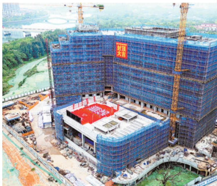
▲复旦大学附属中山医院厦门医院科研教学楼(首批国家区域医疗中心项目)封顶。

2023年第一季度进度条刚刚加载完毕，回眸凝望，鹭岛大地热潮涌动，项目建设战鼓正酣。岛内大提升指挥部紧盯目标任务，真抓实干，以全市一季度重大片区项目建设现场评价活动为契机，激发推动发展的强劲动力，持续升腾奋进建设的强大气场，奏响激情澎湃的春天“奋进曲”。