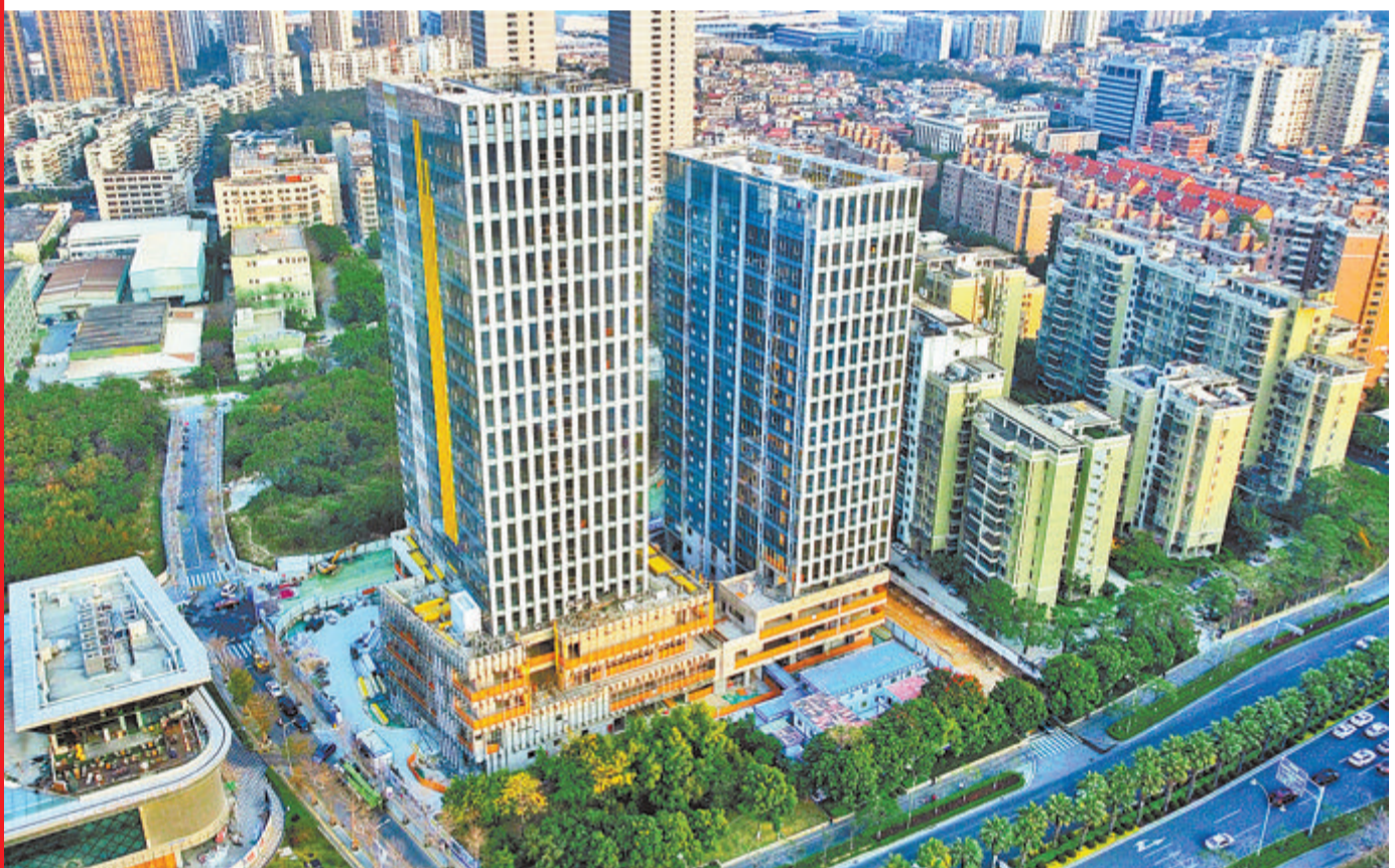
▲奥佳华总部大楼和奥佳华商务中心计划今年5月竣工。

紧紧牵住项目建设的“牛鼻子”，指挥部围绕重点项目、重点任务，深入基层、下沉一线，协调解决困难问题，紧盯一季度目标，统筹协调，推动项目建设要素保障，为完成全年目标任务增动力、激活力、聚合力。截至3月底，高林安置房一期工程、高林-金林社区发展中心等9个项目新竣工，总投资258亿元，项目建设喜迎“开门红”。