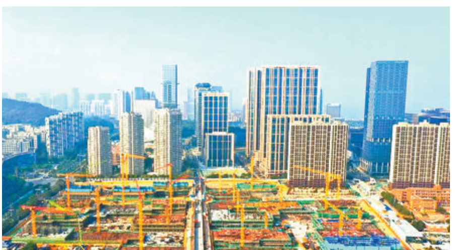
▼何厝安置房建设如火如荼。

不负春光敢争先，踔厉奋发齐奋斗。踏着铿锵的步伐，岛内大提升指挥部以时不我待、只争朝夕的精气神，乘势而上，擂响战鼓，奋力推进本岛提升驶入高质量发展的快车道，谱写现代化城市建设幸福篇章。