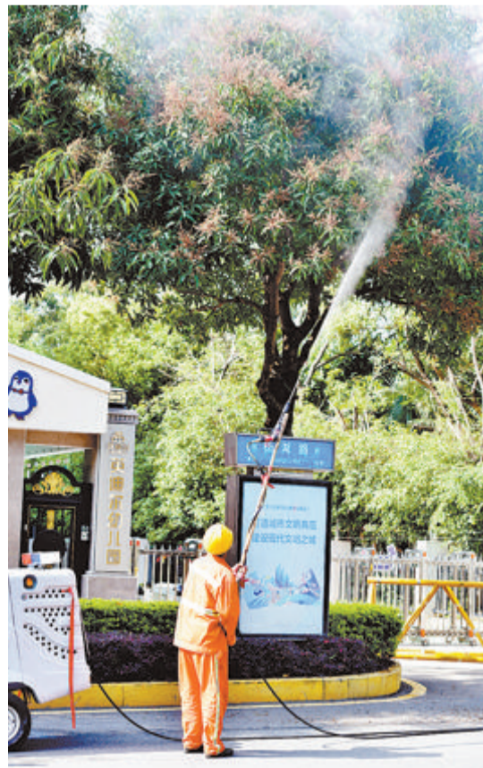
厦门市市政园林局开展芒果树抑花控果工作。

市市政园林局工作人员表示,行道上的芒果树不是按果园的标准栽培的,除了个头较小、表皮青绿、口感很差外,为防治病虫害,市政园林部门会定期喷洒农药水,加上芒果树长期吸收机动车尾气、粉尘等,果实中极有可能含有硫或铅等,这样的“绿化芒”食用后对人体有一定危害。