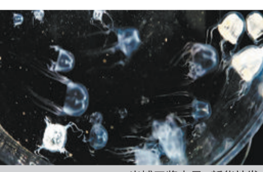
米埔三桨水母

新华社香港4月18日电 香港浸会大学18日宣布，该校科研团队在香港发现一个箱形水母新物种。这是首次在中国水域发现箱形水母新物种，至此全世界箱形水母纲三桨水母科的物种数目增加到四个。相关研究论文近日已刊登在国际期刊《动物学研究》。