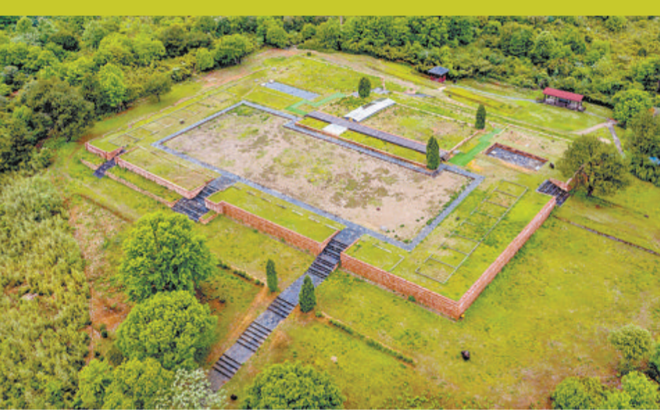
位于兴田镇城村遗址的汉代闽越王城旧址。

据央视新闻报道 昨天是国际古迹遗址日，国家考古遗址公园现场工作会议在武汉召开。会上，国家文物局发布《国家考古遗址公园发展报告(2018—2022)》。同时，举行了第四批国家考古遗址公园授牌仪式。截至目前，全国共评定出55家国家考古遗址公园，其中福建省有两家，分别是万寿岩国家考古遗址公园和城村汉城国家考古遗址公园。数据显示，2018年至2022年，55家国家考古遗址公园累计接待游客1.46亿人次。