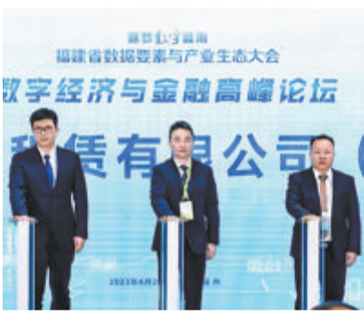
福建大数据产业融资租赁有限公司在数字经济与金融高峰论坛现场揭牌。

本报讯(文/图 记者 邵凌丰 通讯员 余巧梅)近日,第二届福建省数据要素与产业生态大会在福州市举行,大会是第六届数字中国建设峰会的重大活动。作为大会的系列重大活动之一,数字经济与金融高峰论坛以“数字经济”和“金融”为主题,邀请众多业内专家、学者、政府部门和企业代表汇聚一堂,为数字企业与金融资本搭建起交流合作平台。尤其值得一提的是,在论坛现场,福建大数据产业融资租赁有限公司正式成立,并举行公司揭牌仪式。