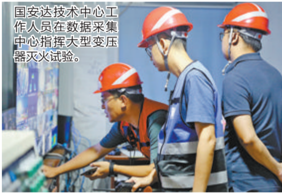
国安达技术人员在数据收集中心指挥大型变压器火次试验。

作为国安达股份有限公司(300902)的核心力量,技术中心主要承担重大课题研究、新产品自主研发、产品技术升级、技术交流、技术服务等任务,不断研发适用于电力电网、交通运输、新能源、应急救援等重要领域的核心技术和硬核产品,每年获得国家科研基金补贴、研发经费超千万元,先后获评“福建省工人先锋号”“厦门市工人先锋号”等荣誉。