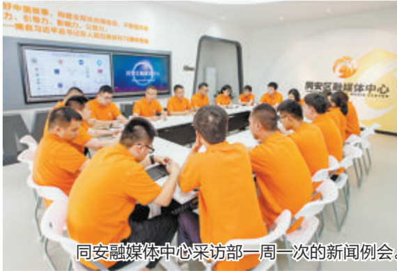
同安融媒体中心采访部一周一次的新闻例会。

同安区融媒体中心提供党建、政务、公共、舆情等公益性综合服务。2021年,该中心采访部两次获评学习强国全国县级融媒体中心优秀作品双月赛二等奖;2022年,先后获得福建新闻奖一、三等奖及科技部视频奖三等奖,省委宣传部、网信办短视频大赛三等奖;省委宣传部、网信办短视频大赛三等奖;省委宣传部、网信办短视频大赛三等奖;省委宣传部、网信办短视频大赛三等奖。融媒体中心成功入选全省30强,排名位居全市各区前列。