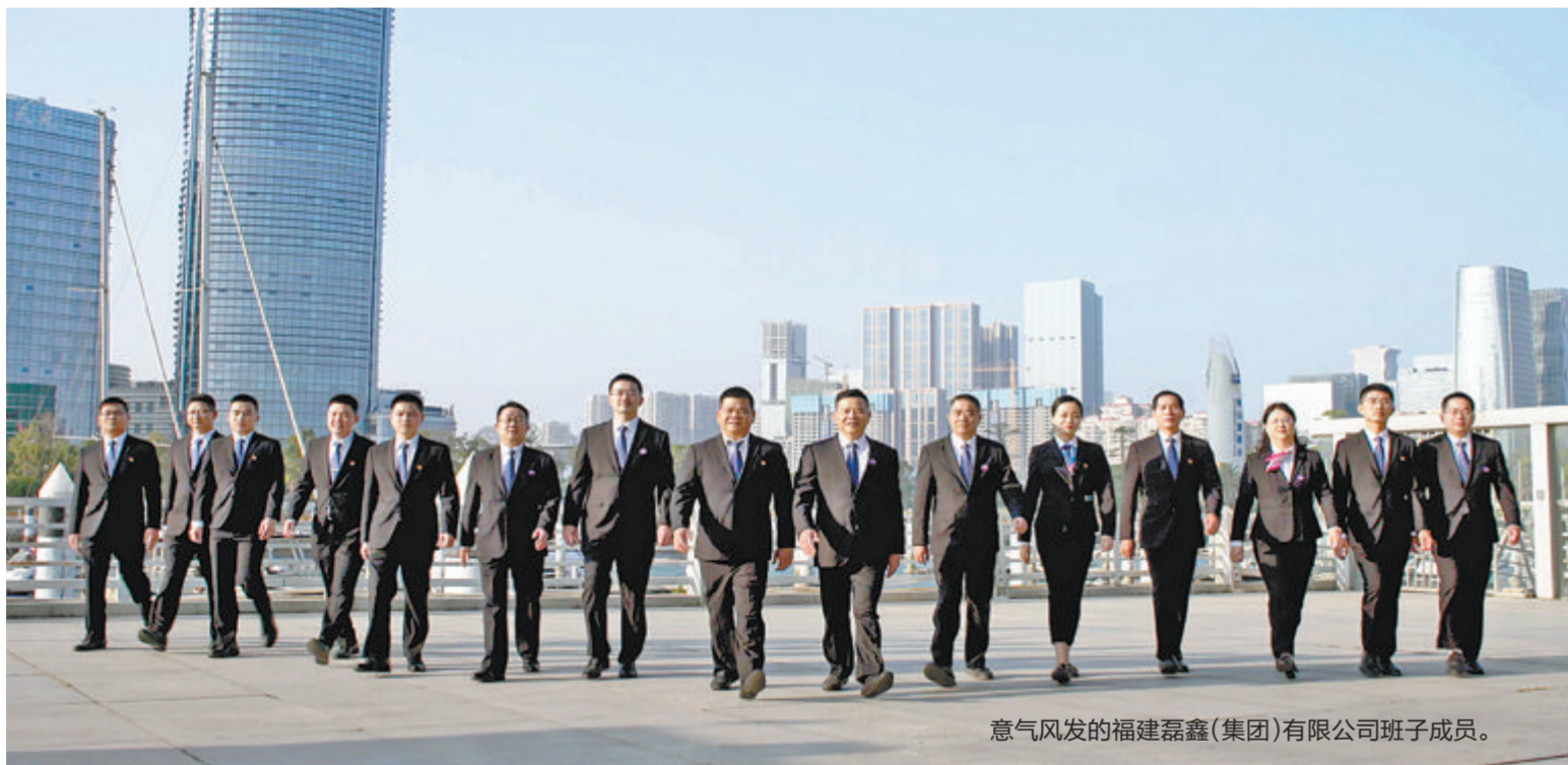
意气风发的福建磊鑫(集团)有限公司班子成员。