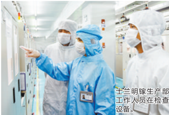
士兰明镓生产部工作人员在检查设备。

厦门士兰明镓化合物半导体有限公司是专业从事高端LED芯片、先进化合物半导体器件及第三代半导体芯片的高新技术企业,士兰明镓生产部从事生产制造,共536名员工。2021年12月,公司生产部荣获厦门市总工会授予的“厦门市五一先锋号”;2022年5月,荣获福建省总工会授予的“福建省工人先锋号”。