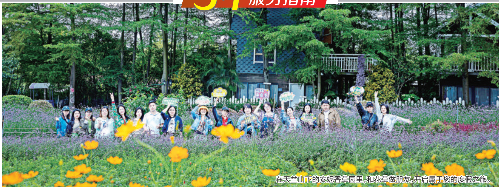
在天竺山下的安妮香草园里,和花草做朋友,开启属于您的度假之旅。

东孚之美,美在乡村! 4月25日-26日,“天竺山下·慢煮乡野”2023年海沧区东孚街道乡村旅游春季踩线活动火热进行。在乡村中感受美景,在古厝中品味文化,在农家乐中寻觅美食……走进东孚美丽休闲乡村,追寻恬静舒适的乡村田园生活。