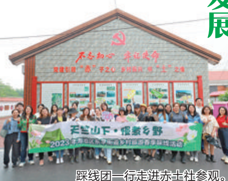
踩线团一行走进赤土社参观。