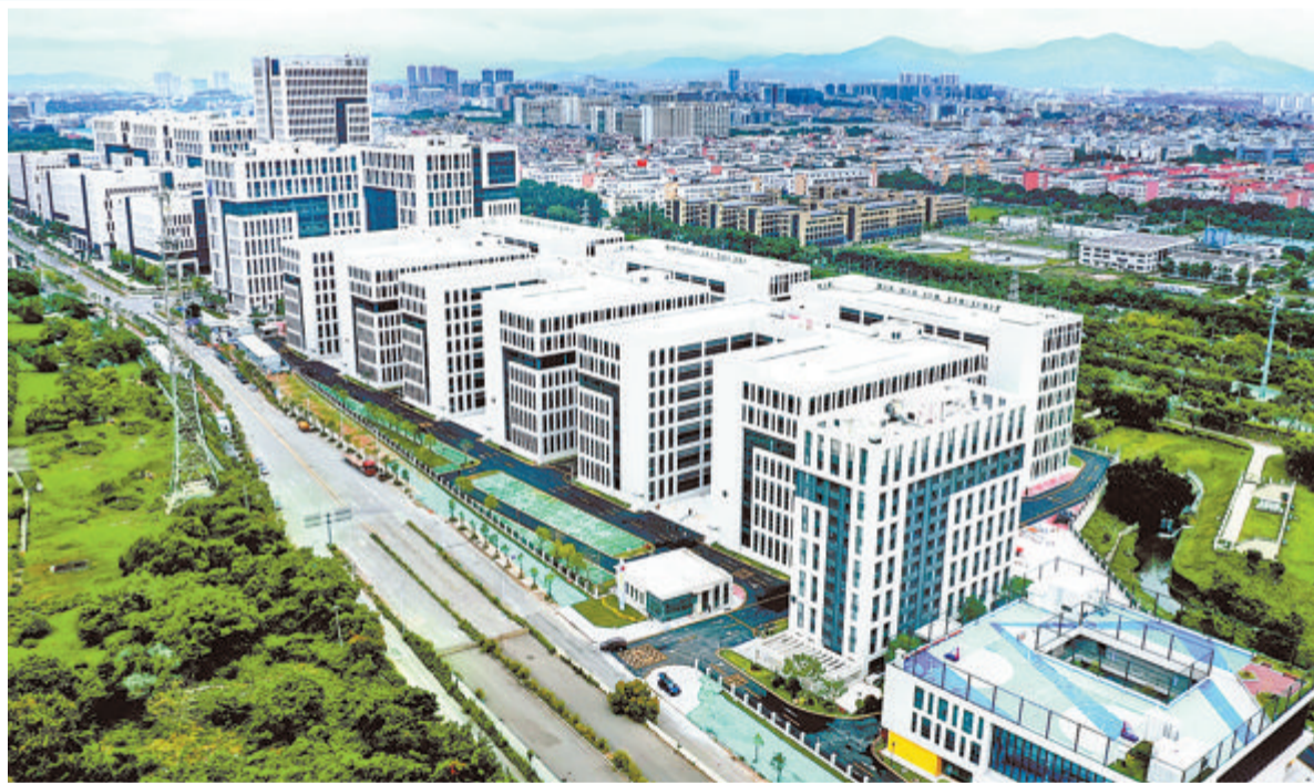
火炬智能制造产业园三期项目即将投用。

产业载体关乎产业集群发展、创新要素集聚。今年以来,火炬集团认真落实省委“深学争优、敢为争先、实干争效”行动部署和市委市政府有关工作要求,大力实施每年开工100万平方米、储备100万平方米、策划100万平方米的“三百万”工程,努力为我市科创产业发展提供源源不断的优质载体,一批先进制造业园区正在加速推进。