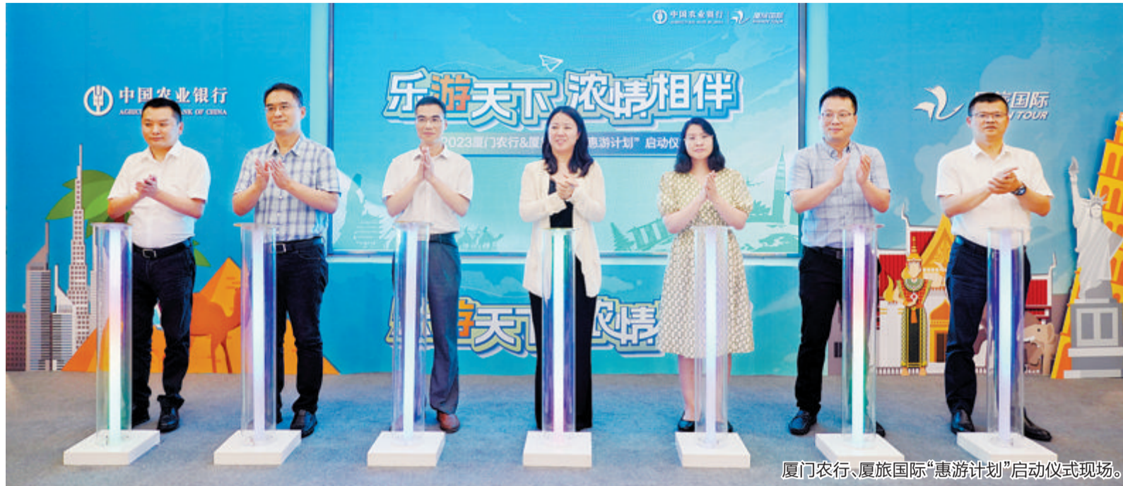
厦门农行、厦旅国际“惠游计划”启动仪式现场。