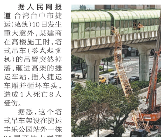
据人民网报道 台湾台中市捷运(地铁)10日发生重大意外,某建商在拆除吊臂的过程中,大约10米长的吊臂从34楼高空脱落,砸中下方的捷运车站,并插入一辆运行中的捷运车厢,玻璃碎裂一地,车厢天花板也掉落,车厢中还有一大截钢筋梁脱落,画面相当惊悚。

据悉,这个塔式吊车架设在捷运丰乐公园站外一栋34层商住大楼顶端,疑似施工人员在拆除吊臂的过程中,吊臂从34楼高空脱落,砸中下方的捷运车站,并插入一辆运行中的捷运车厢,玻璃碎裂一地,车厢天花板也掉落,车厢中还有一大截钢筋梁脱落,画面相当惊悚。台中市都市发展局表示,巴勒令施业者停工并开罚。捷运车厢被吊臂钢筋梁贯穿。