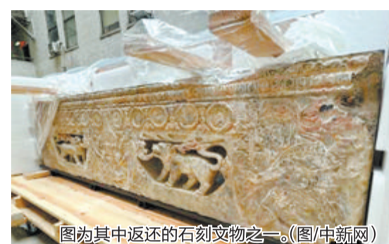
图为其中返还的石刻文物之一。

据中新网报道 据中国驻纽约总领馆消息,当地时间5月9日,经国家文物局授权,中国驻纽约总领事黄屏出席于纽约曼哈顿区检察官办公室举行的中国流失文物返还仪式,与美方签署返还协议,并接收2件重要石刻文物。