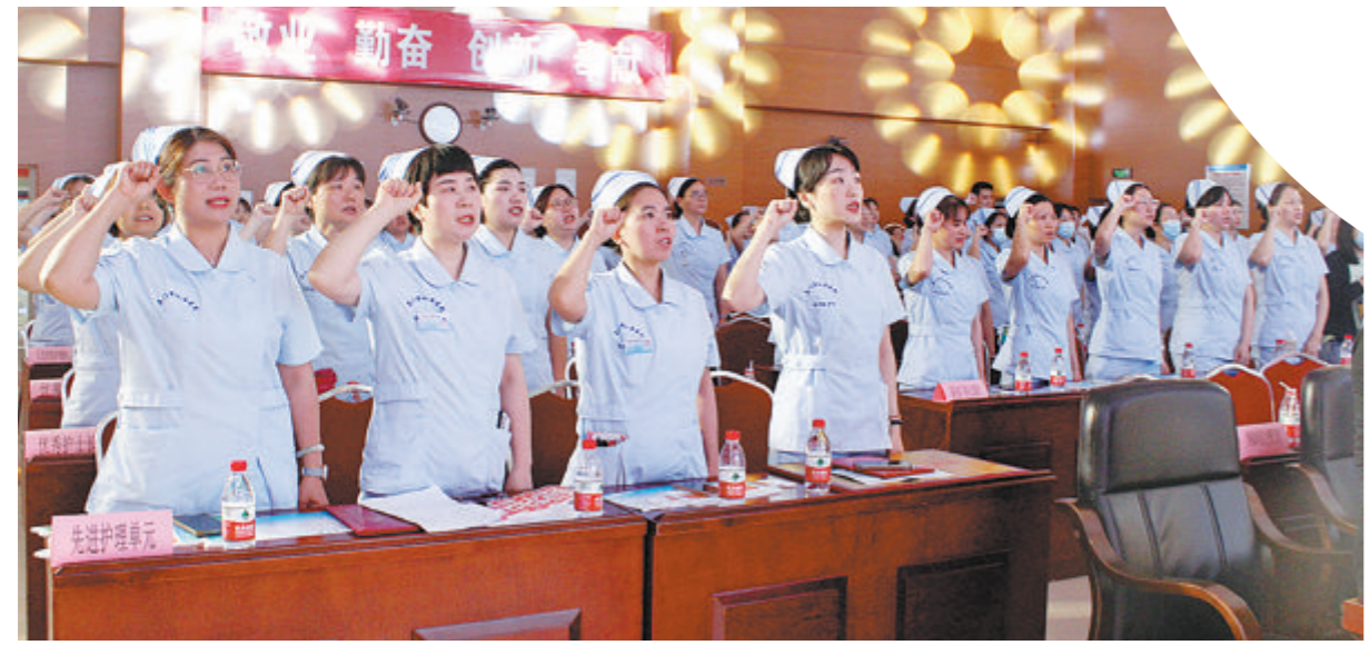
市仙岳医院举办护士节表彰活动,白衣天使宣读南丁格尔誓言。

厦门市仙岳医院作为国家精神心理疾病临床研究中心福建省分中心、福建省精神医学中心、福建省精神疾病临床医学研究中心、厦门市精神卫生中心,诊疗服务辐射厦门乃至福建省周边区域。当前,医院围绕五大中心、四大基地全面推进高质量发展。该院以叙事护理为载体,不断提升护理的人文内涵和专业技能,提倡用心聆听,走进患者内心世界,用“对”的方式陪伴和帮助,促进精神康复。