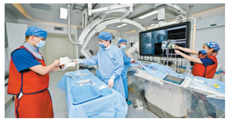
介入护理人员身穿红色铅衣,在手术台上连续奋战。