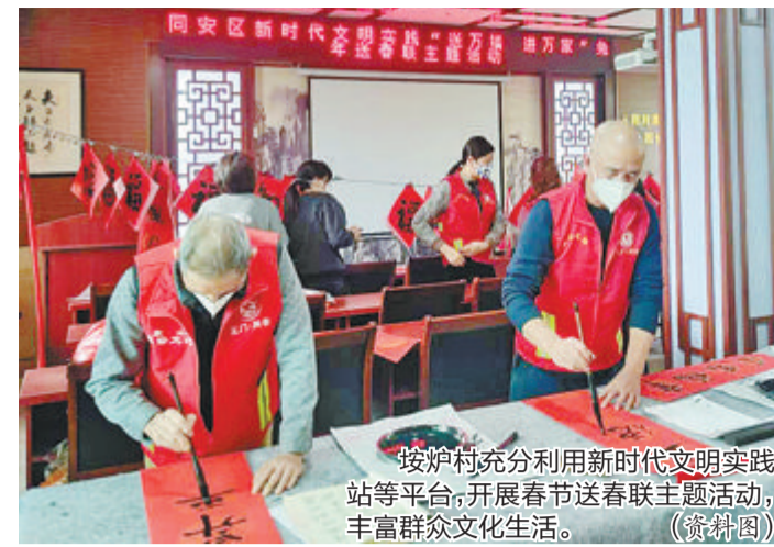
按炉村充分利用新时代文明实践站等平台,开展春节送春联主题活动,丰富群众文化生活。(资料图)