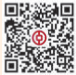
“中国银行厦门分行”公众号二维码

时间: 5月20日-5月21日 18:30-21:30 地点: SM厦门三期外广场