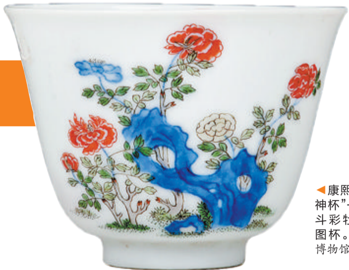
康熙“十二花神杯”——青花斗彩牡丹诗文图杯。

本报讯(记者 郭睿 通讯员 郑婷楠)第47个“国际博物馆日”来临之际,厦门市博物馆携手景德镇中国陶瓷博物馆,共同推出“盛世之器——清代康雍乾时期景德镇陶瓷珍品展”,展览将于5月18日正式与观众见面。