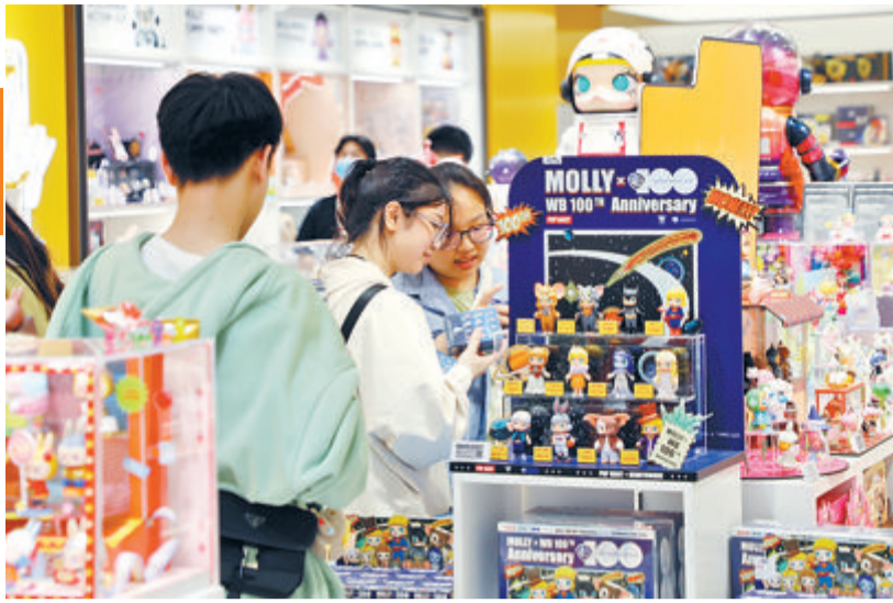
市民在SM商圈购物。

本报记者 严明君 免费抽盲盒、问答赢好礼、消费优惠多……本周末晚,一起到SM厦门三期外广场,给初夏的夜晚创造美好的回忆吧!