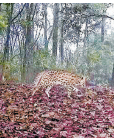
▲红外相机镜头下的豹猫。

本报漳州讯(特派记者 黄树全)日前,漳州市南靖县虎伯寮国家级自然保护区(以下简称虎伯寮保护区)惊现一只罕见的国家二级重点保护野生动物——豹猫。据悉,这是虎伯寮保护区首次监测到豹猫实体。截至目前,该保护区已发现625种野生动物,其中珍稀动物264种。