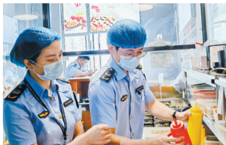
▲食安特勤队队员、执法人员发现私订osaka食堂外带寿司餐厅的专间调味料罐外未张贴品名、启用日期等食品标签。