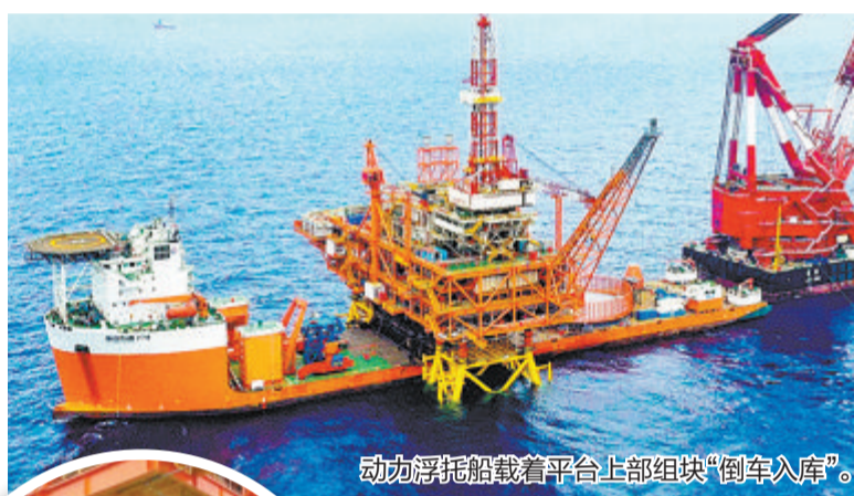
动力浮托船载着平台上部组块“倒车入库”。