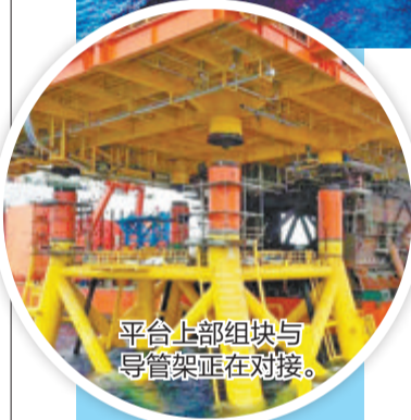
平台上部组块与导管架正在对接。