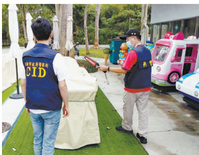
高雄市寿山动物园18日上午收到“炸弹”恐吓信,园方紧急报警并休园,警方进入园内全面巡检。

台媒称,近期台岛多个公共场所接获“炸弹”恐吓信。位于屏东的台湾海洋生物博物馆、位于新北的台湾图书馆5月16日收到“炸弹”恐吓信。当地警方接报后到场搜索,未发现爆炸物。