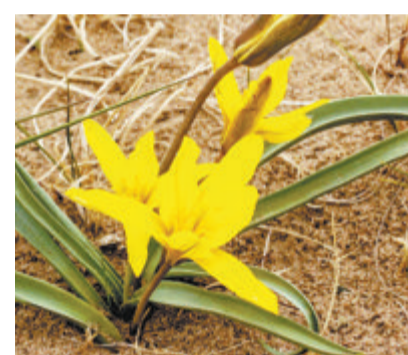
内蒙古赤峰市阿鲁科尔沁旗境内发现的蒙古郁金香。

据新华网报道 记者日前从内蒙古赤峰市阿鲁科尔沁旗境内的高格斯台罕乌拉国家级自然保护区管理局获悉,消失40余年,曾被认为野外功能性灭绝的国家二级保护植物——蒙古郁金香,近期被科研人员发现。