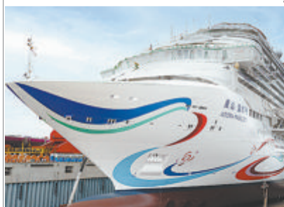
建造中的“爱达·魔都”号。

“爱达·魔都”号全长323.6米，总吨位13.55万吨，可搭载乘客5246人。计划于2023年年底交付后开启以上海为母港的国际航线，执航日本及东南亚航线，并适时推出“海上丝绸之路”等中长航线，打造长、中、短相结合的多样旅行度假选择，以邮轮为载体，展现中国形象、讲好中国故事、宣传中国文化、增进中外交流，更好地凝聚起“一带一路”沿线国家对中国的文化认同。