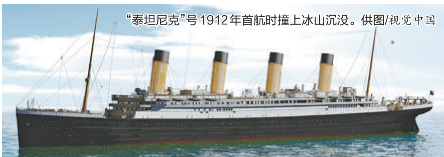
“泰坦尼克”号1912年首航时撞上冰山沉没。

据新华社电 研究人员近日利用深海测绘技术为大西洋底的“泰坦尼克”号绘制出首张全尺寸数字扫描图像，希望帮助解开这艘沉没了100多年的巨轮上不为人知的谜团。