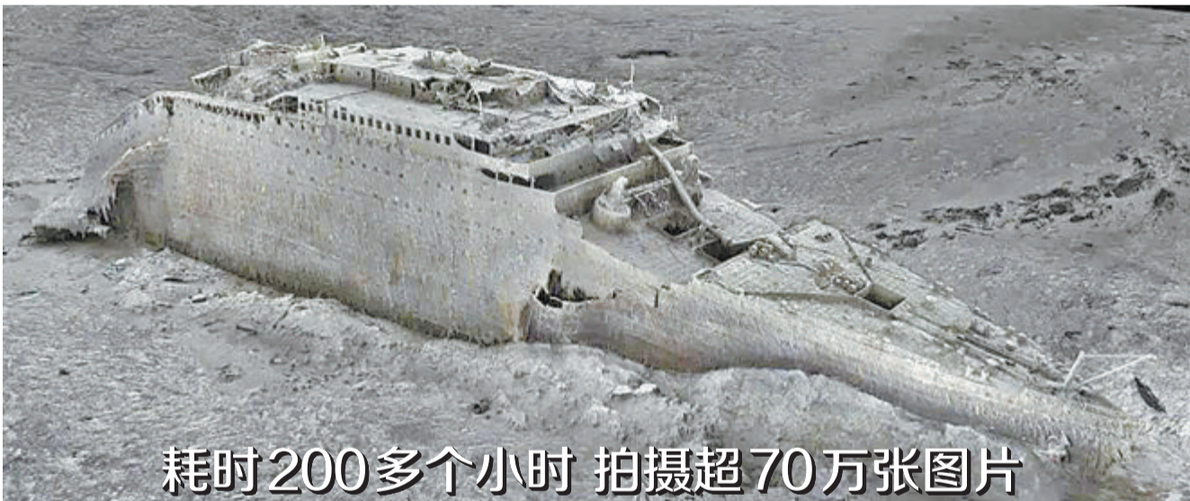
耗时200多个小时 拍摄超70万张图片