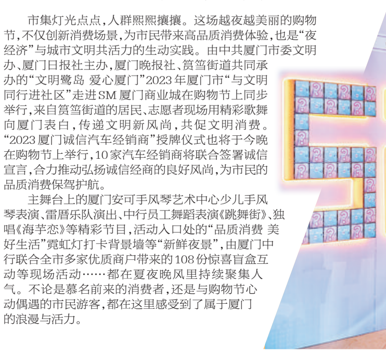
市民打卡中行盲盒。