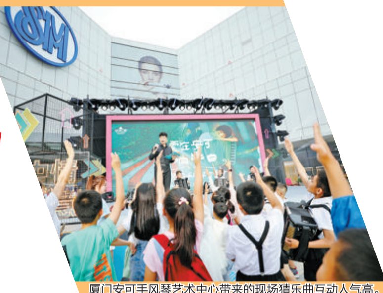
厦门安可手风琴艺术中心带来的现场猜乐曲互动人气高。

昨日,中国银行厦门市分行党委委员、副行长纪志强说:“此次和厦门日报社联合主办购物节活动,召集特色商家客户齐聚于SM厦门商业城,致力于满足广大市民群众的多元消费需求和对美好生活的向往。”