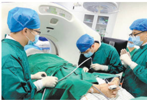
►厦门医学院附属第二医院呼吸病医院团队医师开展经皮植入放射性粒子治疗肺癌。