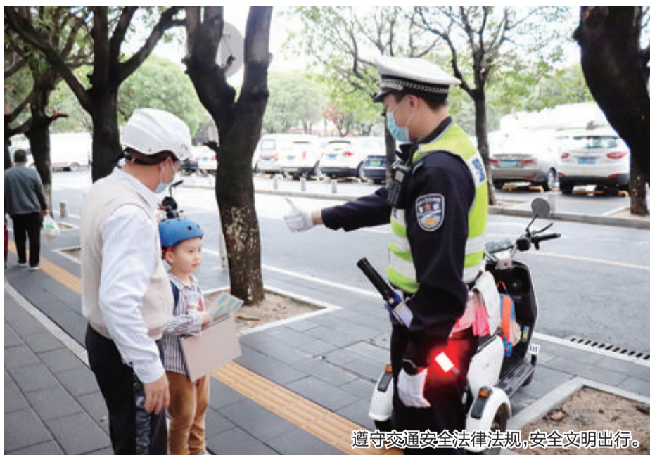
遵守交通安全法律法规,安全文明出行。

近期天气多变,降雨多发。骑乘两轮车出行时,由于雨天视线受阻、路面湿滑,极易发生危险。今天,“老”交警大刘警官就来给大家说说雨天骑乘两轮车的安全注意事项。