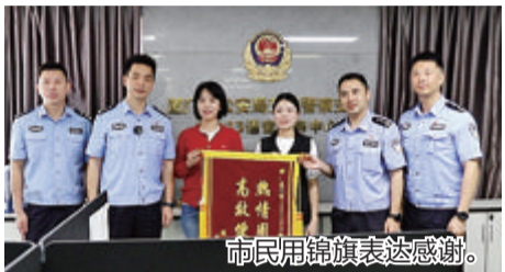
市民用锦旗表达感谢。