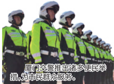
厦门交警推出诸多便民举措,为市民群众服务。

除了民意服务中心,厦门交警已经陆续推出诸多便民举措,如在车管所开辟“物流运输联审联办”一件事服务站,方便全市运输车辆办理车辆转移登记、变更登记道路运管证;专门设置“老、残、孕绿色通道”“办不成事反映窗口”,为有特殊