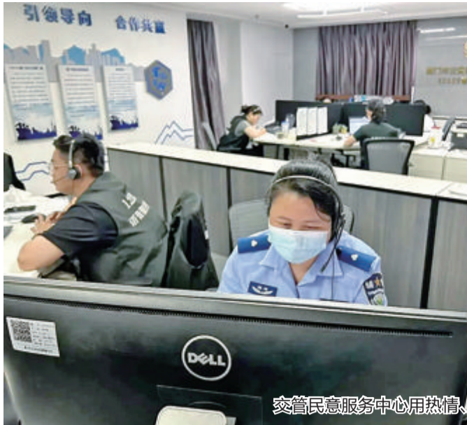
交管民意服务中心用热情、周到的服务为民排忧解难。