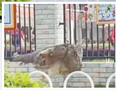
这只鸵鸟大摇大摆现身学校附近。(本组图/视频截图)