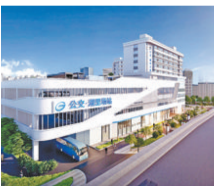
湖里公交生产生活基地效果图。

本报讯(记者 林钦圣 通讯员 江安娜)记者昨从厦门公交集团获悉，湖里公交生产生活基地主体顺利封顶。截至目前，项目完成进度约65%，预计明年5月建成投用。