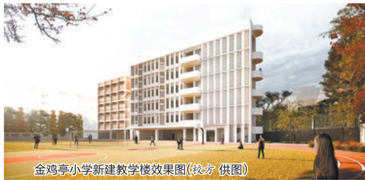
金鸡亭小学新建教学楼效果图

地来形容——校舍建筑面积接近翻倍，解决了长期困扰师生的消防问题，运动场地进一步优化。他说，这真是送给孩子的一份“六一”大礼。