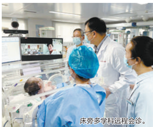
床旁多学科远程会诊。

厦门市委市政府先行先试，于2014年采取“市校合作”模式，与复旦大学共建厦门市儿童医院，由国家儿童医学中