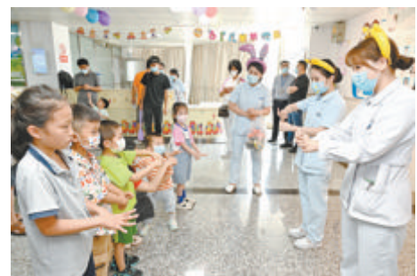
▲护士带领候诊区的孩子们学洗手操。

“小汽车要吗?”“喜不喜欢奥特曼?”昨天，不少家长一大早就带着孩子来到门诊现场。医护人员戴上卡通发夹，和孩子们亲切互动。在候诊区，护士们亮出各种玩具，吸引了不少孩子的注意力。为了得到心仪的玩具，孩子们在护士的带领下，纷纷学起了洗手操。在欢乐的氛围中，孩子们既学到了健康知识，又缓解了紧张情绪。