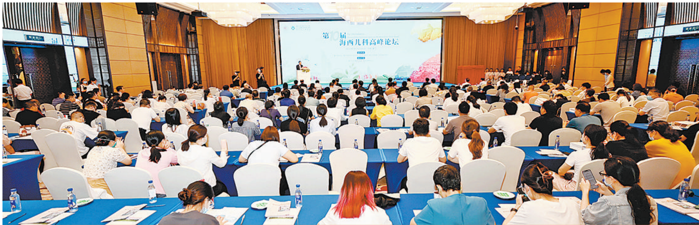
海西儿科论坛已成为国内具有重要影响力的品牌学术会议。

第十届海西儿科论坛昨在厦举行 复旦儿科厦门医院(厦门市儿童医院)国家儿童区域医疗中心建设成果获点赞