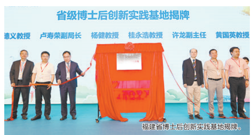
福建省博士后创新实践基地揭牌。

人才是实现高质量发展的第一资源，博士后平台是科技创新的人才强国战略助推器。今后，复旦儿科厦门医院(厦门市儿童医院)将依托博士后创新实践基地这一重要平台，厚植儿科学人才沃土，赋能儿科医疗高质量发展，开展《先心病合并内脏异位症的遗传突变及其致病机制研究》《MYRF基因异常在圆锥动脉干畸形发生中的致病机制研究》《早产儿脑损伤和脑病新策略研发》等研究项目，为“科教兴院、人才强院”注入更多内涵，增添更多动力。