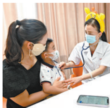
▲上海专家在厦门义诊。

复旦儿科厦门医院(厦门市儿童医院)自建院以来，每年“六一”都会携手复旦大学附属儿科医院开展联合义诊，为孩子们献上儿童节健康大礼。今年的联合义诊活动火爆依旧，预约号一放出就“秒光”。6月1日当天，来自上海总院和厦门医院的儿科专家为近200名患儿提供了义诊服务。记者从现场了解到，前来咨询的多为厦门及周边地区患儿，也有家长专程从外省赶来，就是为了在厦门见到平时“一号难求”的儿科专家。