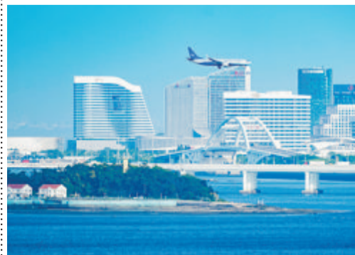
▲我市奋力绘就生态环境高颜值,助推经济发展高素质。图为五缘湾美景。

省对市生态环保目标责任考核得分94.5分,连续三年全省第一,考核六个主要领域中,低碳节能和资源保护、生态保护、环境治理和监管、区域突出问题整治得分均排名第一,我市在全省2021—2022年污染防治攻坚战考核中成绩持续排名全省第一。