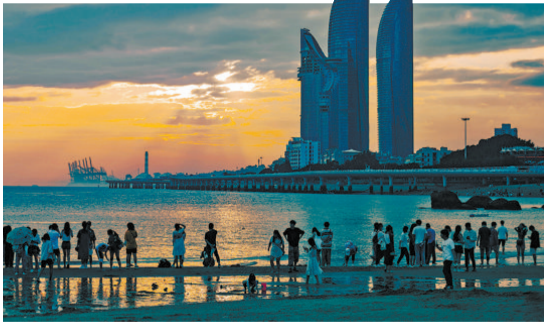
在厦门,随处可见人与自然和谐共生的美好画卷。

市敢闯敢试,不断深化改革创新。创新开展生态文明建设“三合一”目标评价考核体系;在全国率先实现“三线一单”成果落地应用,环评管理“五个一”典型经验全国推广;筲箕湖综合治理、五缘湾生态修复、多规合一五项改革入选国家生态文明试验区改革措施和经验做法推广清单;东坪山片区近零碳排放区示范工程入选生态环境部绿色低碳典型案例……一系列创新举措,让厦门生态文明体制改革领跑全国。