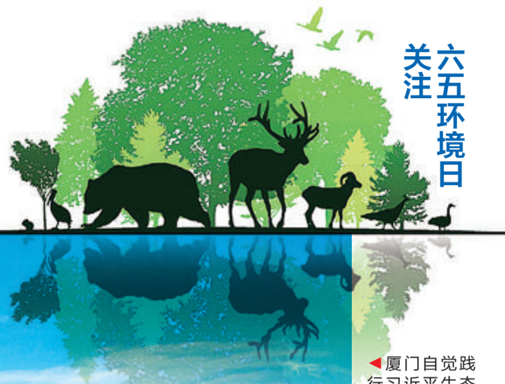
厦门自觉践行习近平生态文明思想,当好生态省建设排头兵。图为鼓浪屿一带风光。

生态市”后,我市获得的第三个国家级生态环境领域综合性荣誉。生态兴则文明兴。新的赶考之路上,生态文明建设成为一道必答题。今天是六五环境日,本报带您深度领略“高素质高颜值厦门”的美好生态图景。