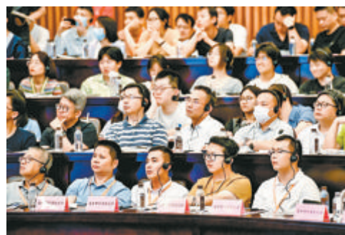
▲活动吸引大批学界业界人士和对城市规划建设感兴趣的市民。

据悉,全球建筑大师论坛自2014年创办以来,已成功举办了13届。九年来,论坛始终坚持创新、开放、包容的理念,坚持“全球化与多样性”的原则,以独特的表现方式,丰富的文化内涵和前沿的设计思路,在促进建筑设计行业发展、提升厦门城市品质、塑造厦门城市品牌等方面发挥了积极作用。从本届开始,全球建筑大师论坛与厦门城市设计周融合举办,在更广阔的平台上发挥论坛在建筑设计领域的理论引领和思想传播作用。