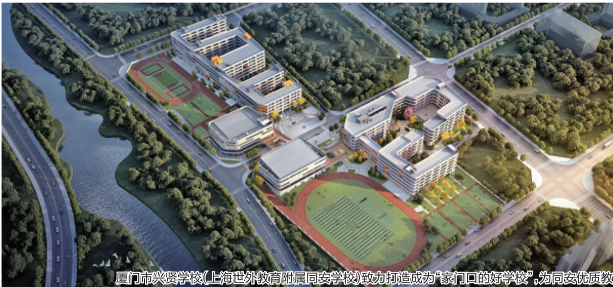
厦门市兴贤学校(上海世外教育附属同安学校)致力打造成为“家门口的优质学校”,为同安优质教育添砖加瓦。(图为学校效果图)

同安区持续完善教师梯次培养体系,加快优质教育资源落地,选派厦门市兴贤学校(上海世外教育附属同安学校)首批教师赴上海世外浸润式跟岗培训,助推学校高起点办学