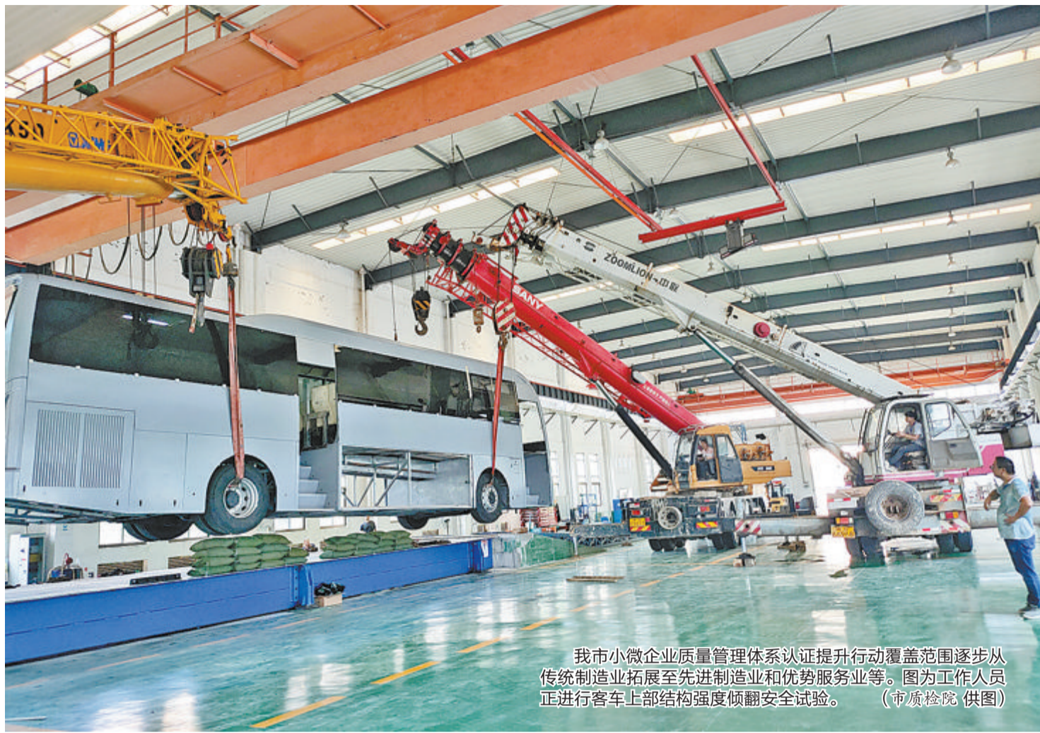
我市小微企业质量管理体系认证提升行动覆盖范围逐步从传统制造业拓展至先进制造业和优势服务业等。图为工作人员正在进行客车上部结构强度倾翻安全试验。

“今年的行动将以‘治当下、管长远、树标杆’为主要目标，重点推进培训教育、实施应用、宣传推广三项重点行动任务。”市市场监管局相关负责人介绍。“治当下”，侧重解决质量管理人才、质量水平不稳定、竞争力不强、管理成本较高等共性问题；“管长远”，侧重指导帮扶建立健全质量管理体系并有效运行，有效提升质量管理水平，助力企业高质量发展；“树标杆”，侧重培育一批质量管理标杆，发挥示范引领作用，以点带面提升行业质量管理水平。今年的行动中，市、区市场监管部门将分层次、分类别组织个性化培训教育，指导企业有效运行质量管理体系，开展内审、管理评审等实践活动；同时，加大宣传推广，宣传典型企业，树立质量标杆，培育中大型品牌、质量奖梯队，通过开展工作成效、成功经验和典型案例分享交流，形成可复制、可推广、可借鉴、可持续的“厦门经验”。