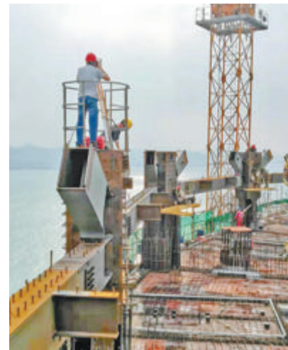
轴线复核。质检人员正在进行高层建筑施工。