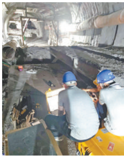
隧道地质超前预报探测。合诚检测工作人员使用TSP系统进行。