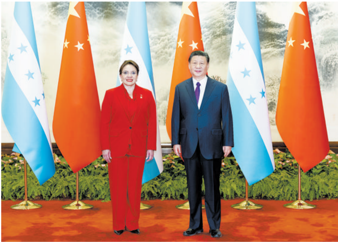
国家主席习近平在北京人民大会堂同来华进行国事访问的洪都拉斯总统卡斯特罗举行会谈。