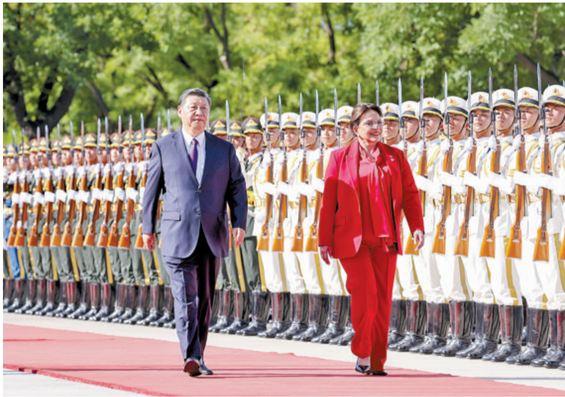
会谈前，习近平在人民大会堂东门外广场为卡斯特罗举行欢迎仪式。

新华社北京6月12日电 6月12日下午，国家主席习近平在人民大会堂同来华进行国事访问的洪都拉斯总统卡斯特罗举行会谈。