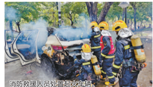
消防救援人员处置起火车辆。

本报讯(文/图 记者 罗子泓 通讯员 陈雅真 何乐山)6月13日下午4点多,海沧区东孚街道办事处附近,一辆停在车位内的新能源小轿车自燃,后备箱底部猛烈燃烧,事发时车主不在场。接警后,新阳消防救援站出动2辆消防车、13名消防救援人员前往处置。约15分钟后,明火被扑灭。