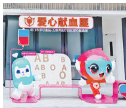
▲新投用的五缘湾医疗园区爱心献血屋。

荣获全国无偿献血促进奖特别奖、单位奖、个人奖以及奉献奖、志愿服务奖获得者代表颁发奖牌和证书,褒扬他们荣获这份属于献血者的国家级荣誉。现场还举行了捐赠仪式,厦门国际银行厦门分行捐款20万元支持厦门市无偿献血公益事业。