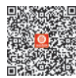
扫码查看 台青表演视频

英雄。”中国国民党青工总会总会长廖怡琇也在海峡青年论坛上献诗一首。从前两年的云端交流,到今年再次论坛相见,廖怡琇盛赞海峡论坛强大的韧性和生命力,尤其是论坛在两岸合作交流中发挥的重要作用。据悉,海峡青年论坛至今已成功举办21届,为推动两岸关系和平发展、融合发展注入了生动的青春力量。