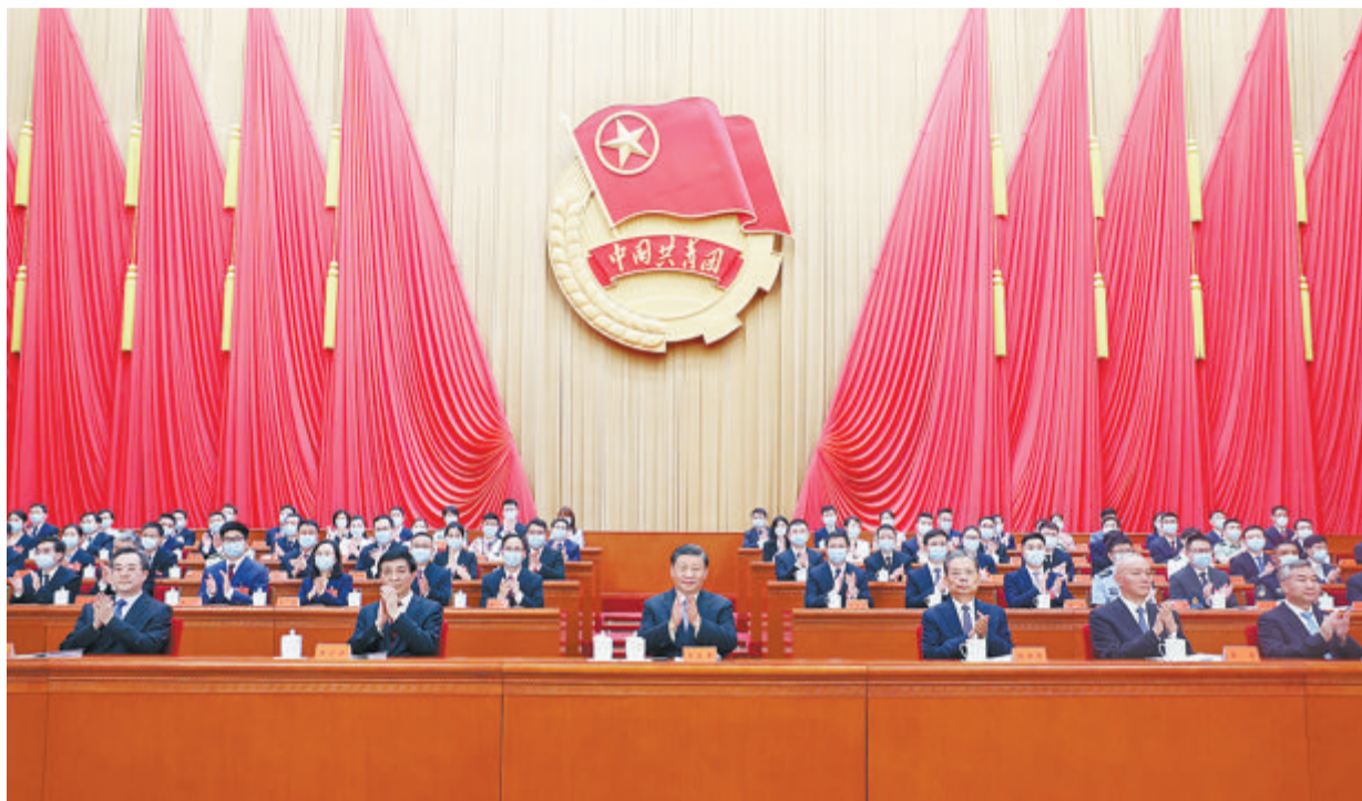
6月19日，中国共产主义青年团第十九次全国代表大会在北京人民大会堂开幕。这是中共中央总书记、国家主席、中央军委主席习近平在主席台向与会代表致意。