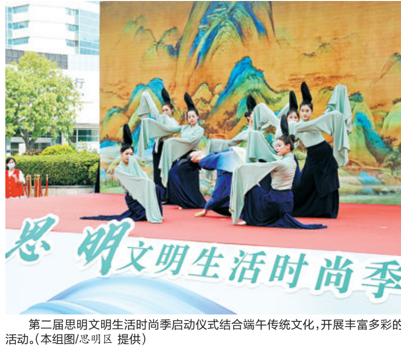
第二届思明文明生活时尚季启动仪式结合端午传统文化,开展丰富多彩的活动。

本次活动人气十足,视频和图片直播吸引720万人次观看。活动由思明区新时代文明实践中心、思明区新时代文明实践志愿服务总队指导,思明区委宣传部、思明区委文明办、思明区文化和旅游局、思明区社会科学界联合会、嘉莲街道党工委、思明区融媒体中心主办,思明区108个新时代文明实践所(站)联合承办。