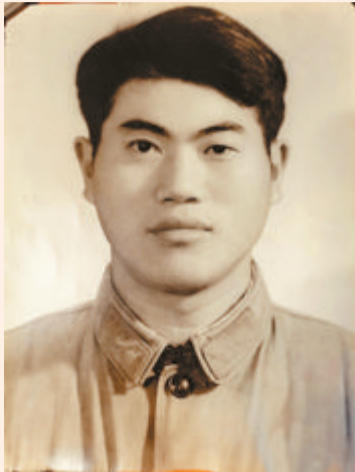
► 年轻时的父亲英俊帅气。