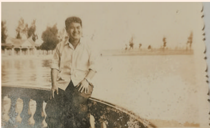
► 1985年夏,摄于集美龙舟池。

1984年父亲从部队转业到了厦门电厂,母亲被安置到集体企业,我们的生活并没有很大的改观。改革开放的春风席卷神州大地,身边不断有人下海经商、辍学打工,各显神通。但父亲依然要求我们安心