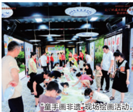
“童手画非遗”现场绘画活动。