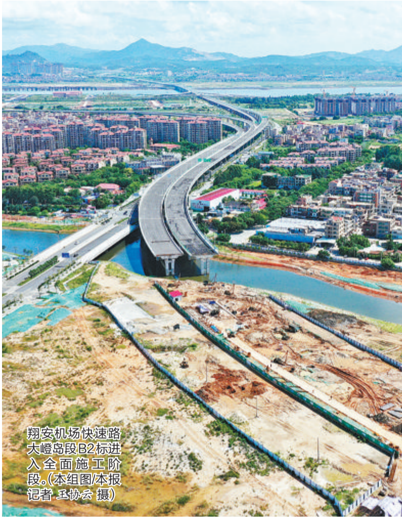
翔安机场快速路大嶝岛段B2标进入全面施工阶段。