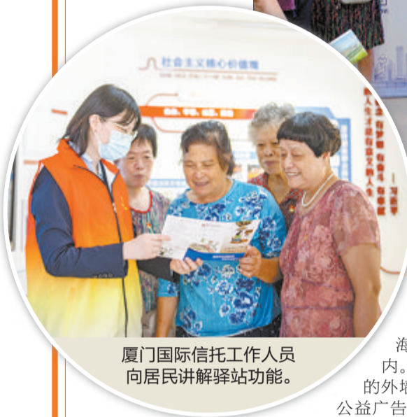
厦门国际信托工作人员向居民讲解驿站功能。