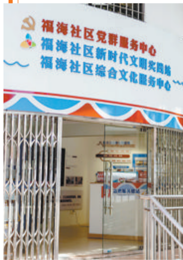
此次共建的金融消保驿站位于厦港街道福海社区党群服务中心内。

昨日,在厦门银保监局的指导下,金圆集团旗下厦门国际信托与厦港街道福海社区共建的“金融消保驿站”正式揭牌,将信托文化普及宣传和金融服务送到社区居民的身边,打通落实金融消保工作的“最后一公里”。