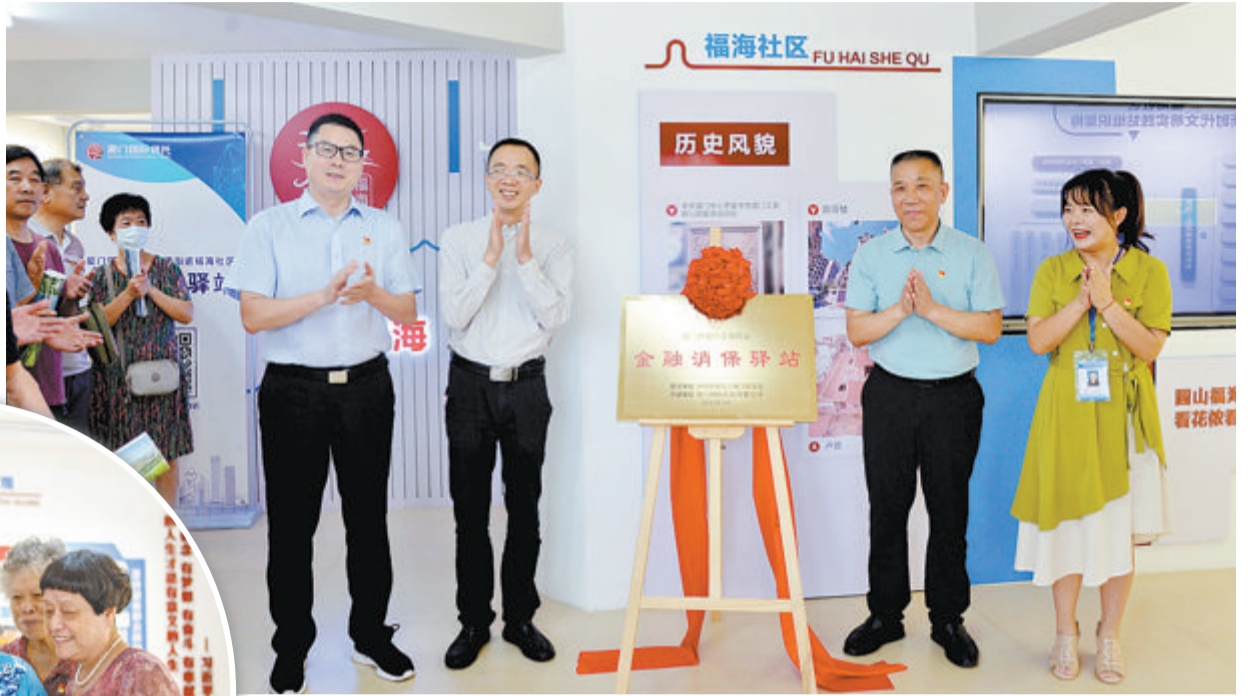
厦门国际信托与厦港街道福海社区共建的“金融消保驿站”昨日正式揭牌。