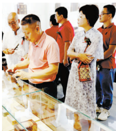
来宾参观中茶海堤博物馆。

7月1日,海堤博物馆暨中茶海堤滨北总店开业仪式在中茶厦门公司举办,中茶海堤博物馆正式揭幕——博物馆通过“实物+图片+AI”等展示,再现中茶厦门公司近70年的发展历程,呈现中国茶的发展历史,讲述海上丝绸之路及“一带一路”沿线国家茶香里的文化故事。值得一提的是,这一博物馆将免费向市民开放。