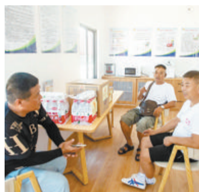
▲户外劳动者在爱心驿站休息。

本报讯(记者 林岑)近日，位于海沧区建港路南侧的贞庵1号停车场爱心驿站正式揭牌，为户外劳动者撑起防暑降温的“乘凉伞”。