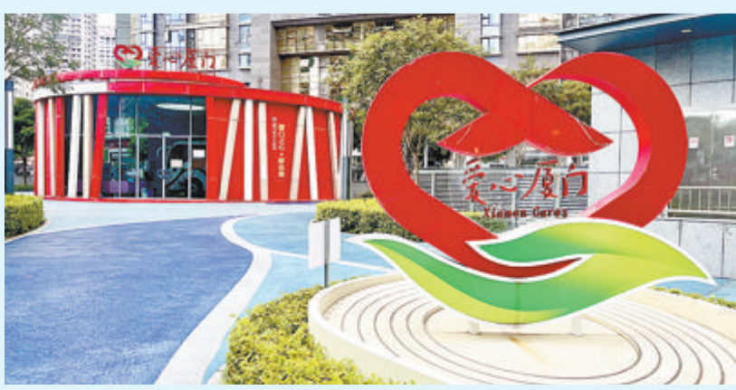
位于吕厝地铁站的爱心献血屋。