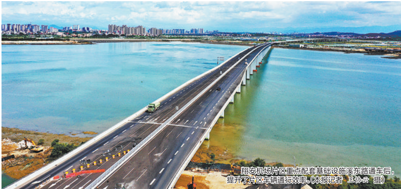
翔安机场片区重点配套基础设施溪东路通车后,提升了片区车辆通行效率。

进行桩基施工,该项目位于同安区,总建筑面积5.5万平方米,主要建设一座天文馆及地下车库等配套设施,计划在2026年投入使用。