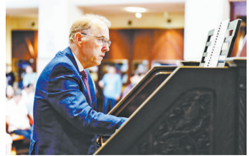
鼓浪屿音乐项目签约仪式现场,托马斯·托特演奏经典曲目。

●“鼓浪屿驻岛艺术家”项目 英国管风琴演奏家托马斯·托特成为“鼓浪屿驻岛艺术家”